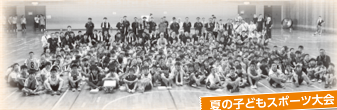
夏の子どもスポーツ大会