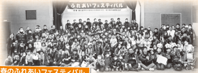
春のふれあいフェスティバル