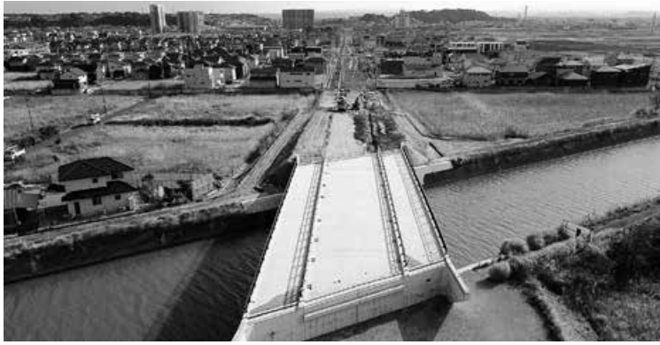
高須箕和田線の一部にかかる橋

A 完成見込みは令和4年の12月です。これから様々な工事が入り、関係機関との調整も含め12月まで工期の幅を持たせていますが、なるべく早く進めたいと考えています。