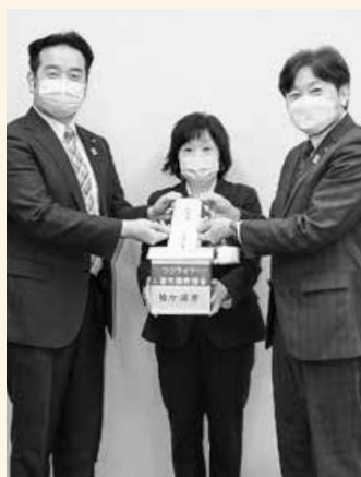
3月20日、26日に 募金活動を行った様子

※ウクライナ人道危機救援金募金箱は市役所本庁舎1階ロビー、平川行政センター、長浦行政センター、ながうら健康福祉支援室(長浦おかのうえ図書館内)に設置されています。