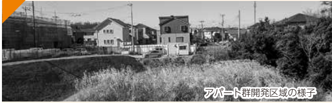
アパート群開発区域の様子